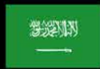
Королевство Саудовская Аравия

Королевство Саудовская Аравия представляет собой основанную в 1932 году монархию. Здесь находятся Мекка и Медина, самые священные города для мусульман всего мира. Эта страна является крупнейшим государством Ближнего Востока с площадью территории порядка 2,15 млн квадратных километров, треть из которых — пустыня. Саудовская Аравия является одним из крупнейших нефтедобывающих регионов мира и занимает первое место по объемам добычи и второе место по запасам нефти в мире. Государственный флаг украшает надпись на арабском языке, которая гласит: «Нет бога, кроме Аллаха, и Мухаммед — пророк его». Зеленый цвет флага символизирует райскую загробную жизнь для истинно верующих, а меч обозначает силу и защиту.