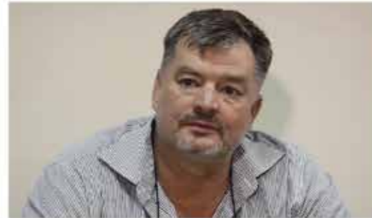
Mohammed Abdallah Sharbatly Co. Ltd.