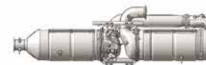
Система очистки отработавших газов DPR-II

Система очистки отработавших газов DPR-II использует дизельное топливо для снижения выбросов NOx из дизельных двигателей. В системе также предусмотрен противосажевый фильтр, благодаря чему обеспечивается удаление из отработавших газов не только NOx, но и твердых частиц (PM). С 2017 года система устанавливается на новые легкие и средние грузовики Hino, поставляемые на рынок Японии.